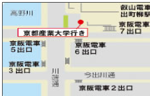
京阪出町柳駅バスターミナル

(34号 7:45 9:20 / 35号 7:25 8:15 8:45 9:50)