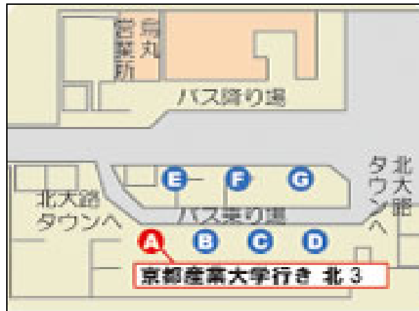
地下鉄北大路バスターミナル 地下2階 A 乗り場

(京都産業大学行 6:52 7:30 7:50 8:10 8:30 8:50 9:10 9:30 9:50)