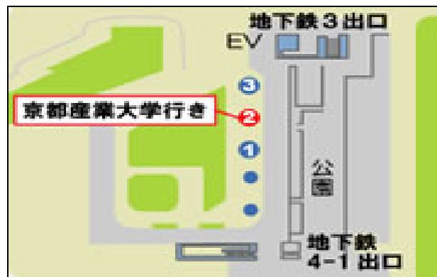
国際会館駅前バスターミナル2番